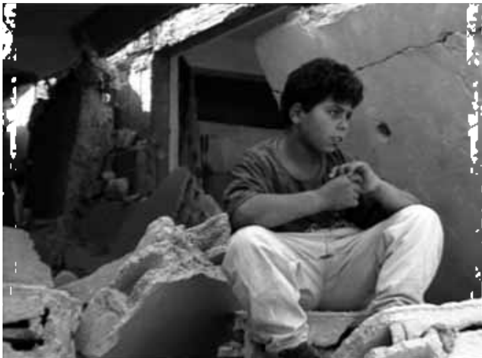
Uit: Arna's children

sprakeloos doen verzuchten: is het dan echt zo eenvoudig? We geven voorbeelden van projecten die beantwoorden aan de door hem gepropageerde universal appeal en desondanks internationaal geen cent oprachten. Zo wint de documentaire Arna's Children op elk festival