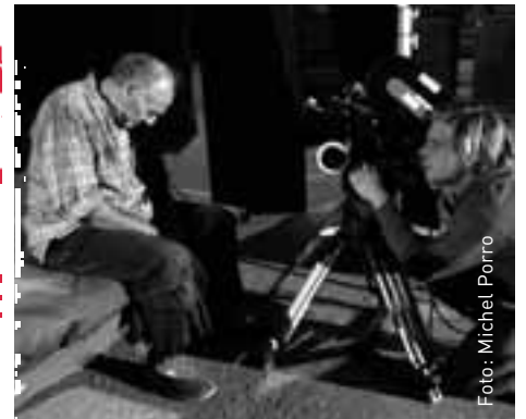
Uit: Strijd der Volharding

Bij de editors is het niet anders. Ook daar wentelt de Publieke Omroep de vereiste bezuinigingen af op de zelfstandig