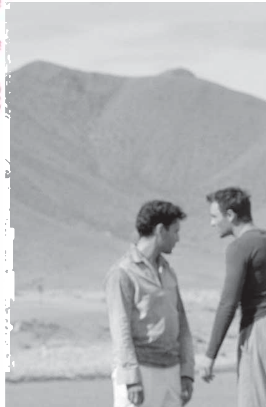
Carice van Houten in Zwarte Zwanen van Colette Bothof

artistieke film) dan niet artistiek is. En terecht, want het antwoord is evident: ja, natuurlijk wel. Wat mij betreft moet die term artistieke film zo snel mogelijk bij het grof vuil. Maar dit terzijde. Binnen Paf hebben we besloten dat het niet de definitie is die alle aandacht zou