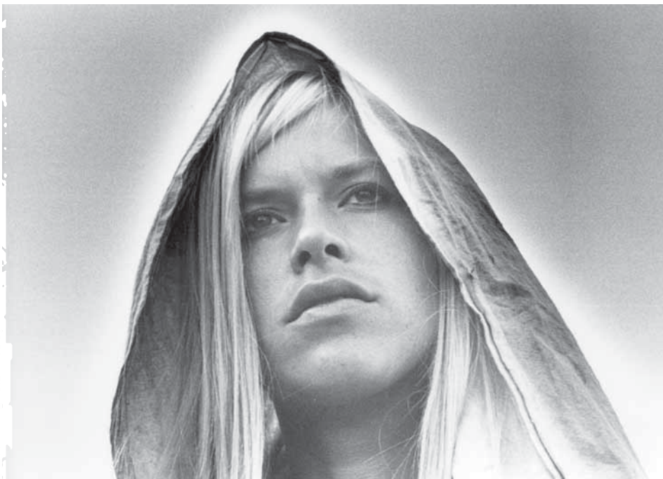
Stelling's Mariken van Nieumeghen (1974): laatste Nederlandse speelfilm in hoofdprogramma Cannes