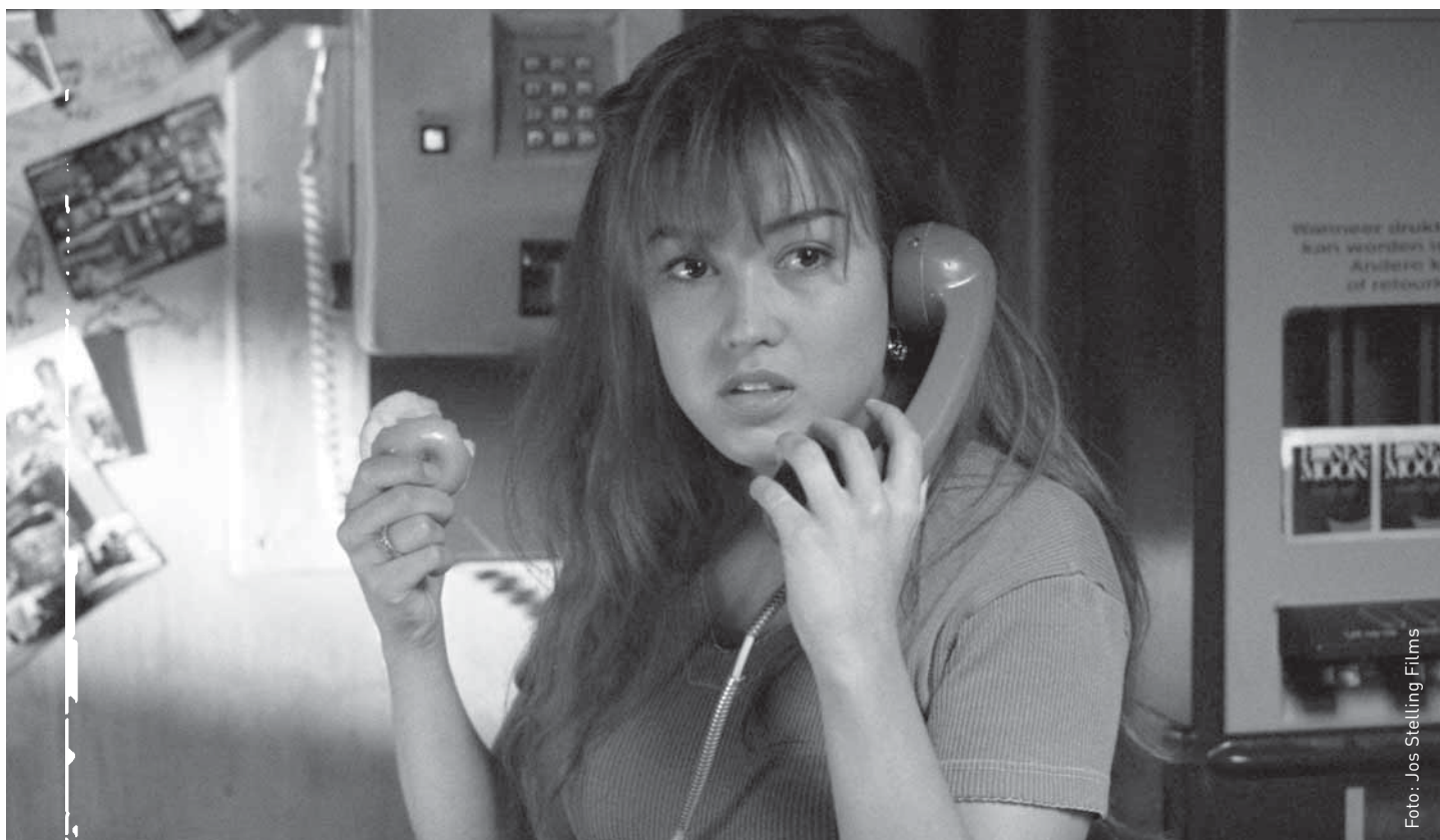
Katja Schuurman in Stelling's No trains, no planes uit 1999.